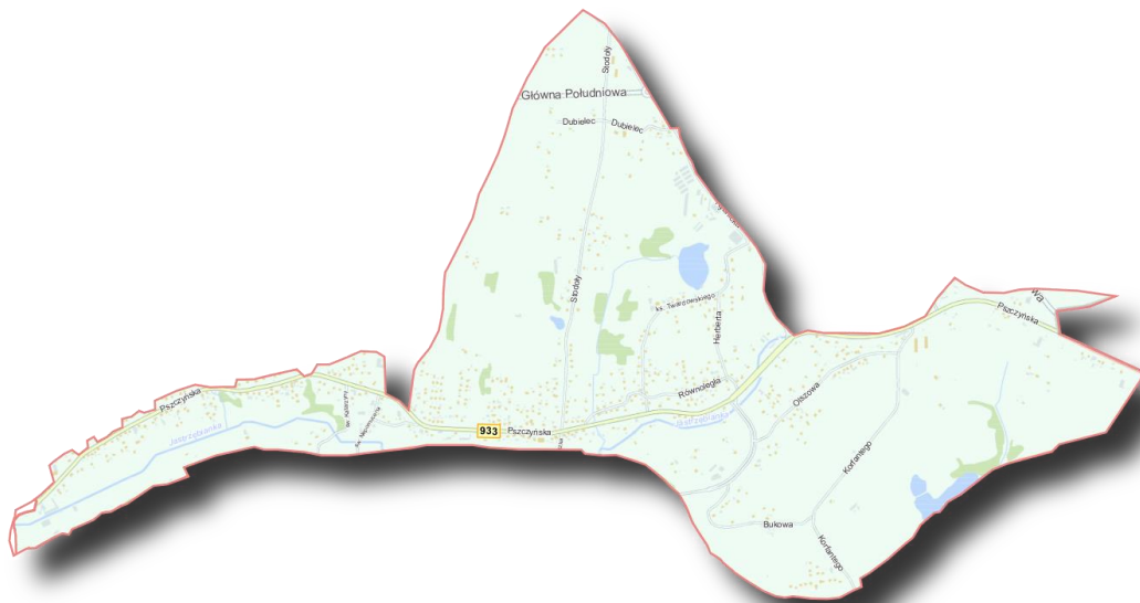
Mapa 9 Obszar rewitalizacji na osiedlu Jastrzębie Górne i Dolne