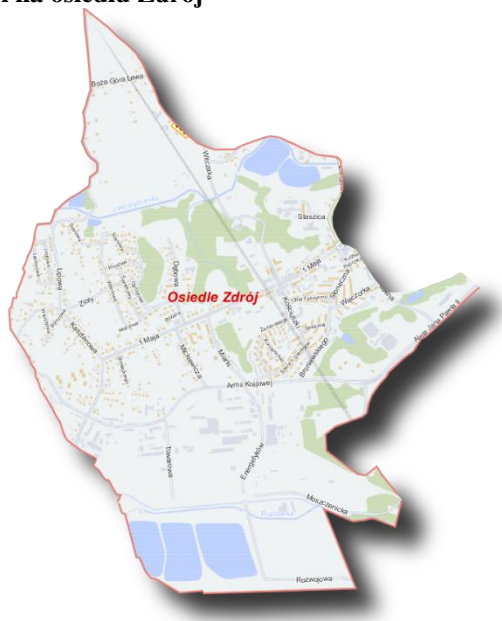
Mapa 13 Obszar rewitalizacji na osiedlu Zdrój