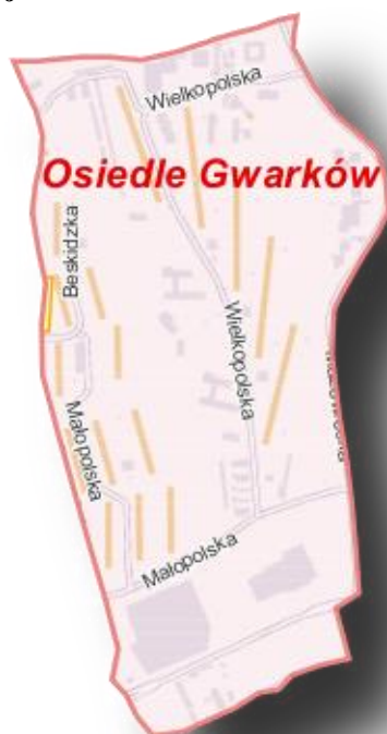
Mapa 8 Obszar rewitalizacji na Osiedlu Gwarków