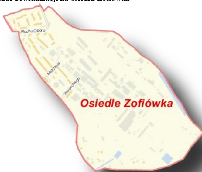
Mapa 11 Obszar rewitalizacji na osiedlu Zofiówka