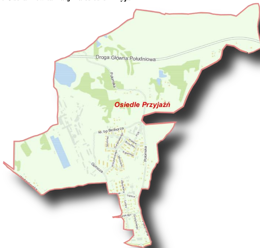
Mapa 10 Obszar rewitalizacji na osiedlu Przyjaźń