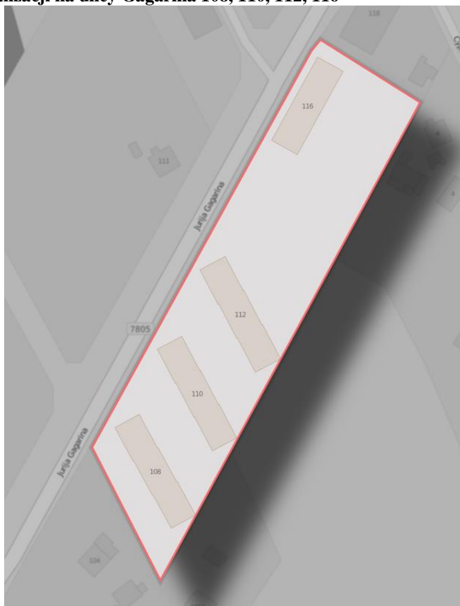
Mapa 14 Obszar rewitalizacji na ulicy Gagarina 108, 110, 112, 116