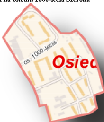
Mapa 12 Obszar rewitalizacji na osiedlu 1000-lecia Szeroka